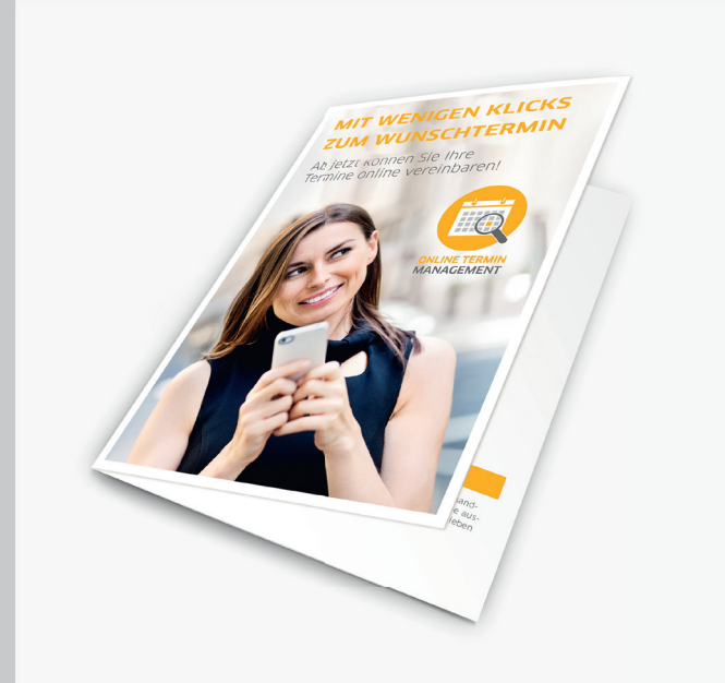
Info-Flyer für Ihre Patienten als Print- und Digitalversion

Sie haben Fragen oder möchten das Online Terminmanagement auch in Ihrer Praxis einsetzen? Wir sind gerne für Sie da!